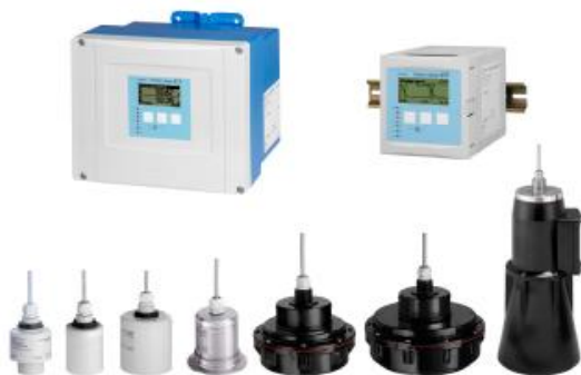
Уровнемеры Prosonic S FDU9x

Внешний вид уровнемеров приведен на рисунке 1.