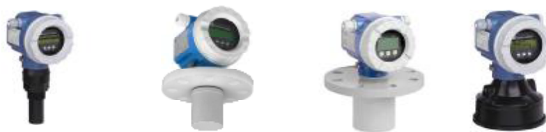
Уровнемеры Prosonic M FMU4x