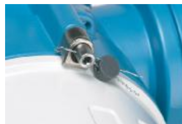
Рис. 3. Схема пломбирования корпуса уровнемера.